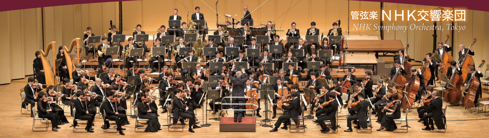
管弦楽 NHK交響楽団 NHK Symphony Orchestra, Tokyo

主催 / NHK名古屋放送局、NHK交響楽団 共催 / 刈谷市、刈谷市教育委員会、 刈谷市総合文化センター 協賛 / 岩谷産業株式会社